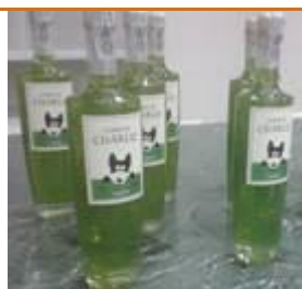
L'erba di Charlie

L'Associazione Fulvio Minetti , nostro Socio di Alessandria ha presentato alla stampa il lancio sul mercato dell'Erba di Charlie, liquore all'alloro, già caro al cuore degli alessandrini per aver portato nelle loro case il musino furbetto del piccolo Charlie, il cagnolino dell'Hospice il Gelso Asl-AI. Charlie non solo è la mascotte del Gelso ma dell'intera città. Una quota fissa dei ricavi della vendita di ogni bottiglia è destinata all'Associazione Fulvio Minetti, che ne devolgerà la metà all'Associazione Tutela Animali che gestisce per il Comune di Alessandria il rifugio Cascina Rosa e il Canile e il Gattile sanitari. Nata da un'idea di un volontario dell'Associazione, la ricetta, per poter soddisfare la produzione per il mercato, è stata rielaborata dallo scienziato/enologo Donato Lanati.